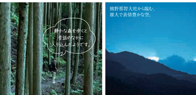
熊野那智大社から臨む、雄大で表情豊かな空。