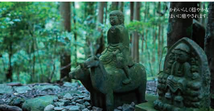
かわいらしく穏やかな佇まいに癒やされます。