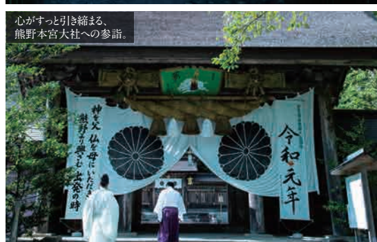
心がすっと引き縮まる、熊野本宮大社への参詣。