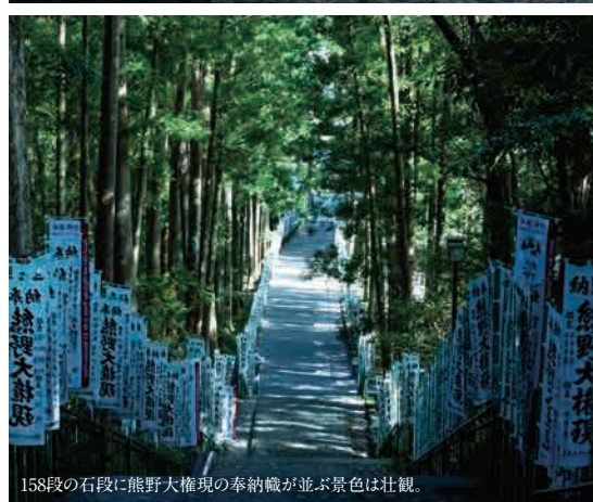
158段の石段に熊野大権理の奉納幟が並ぶ景色は壮観。