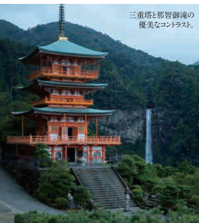
三重塔と那智御滝の優美なコントラスト。