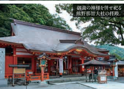
御龍の神様を併せ祀る熊野那智大社の拝殿。