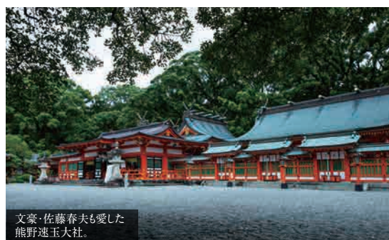
文豪・佐藤春夫も愛した熊野速玉大社。