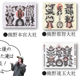
●熊野本宮大社 ●熊野那智大社 ●熊野速玉大社