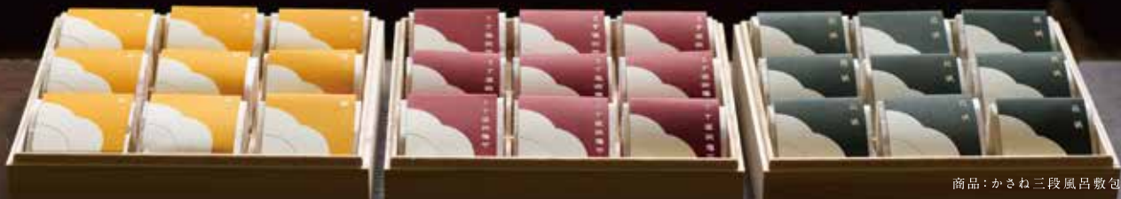
商品：かさね三段風呂敷包み

かねてよりご好評をいただいていた個包装シリーズが、一層美しくリニューアル。梅の花を模したデザインと見目麗しい色彩で、最高級の梅干を包みました。ふたを開けた瞬間に広がるのは、満開の梅林のイメージ。極上のおいしさとともに、胸躍り、心が華やぐギフトです。