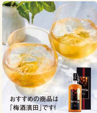
おすすめの商品は「梅酒濱田」です!

これまで度々梅干を食べることはあっても、深く接することはなく、まだまだ梅干についての知識が乏しいのがお恥ずかしいところですが、日々勉強の毎日を送っています。なかなかお客様と直接やり取りをさせて頂く機会が少ない部署ではありますが、いち早く皆様に自信を持って商品をオススメできるよう、そして喜んでもらえるように頑張っていきたいと思います。